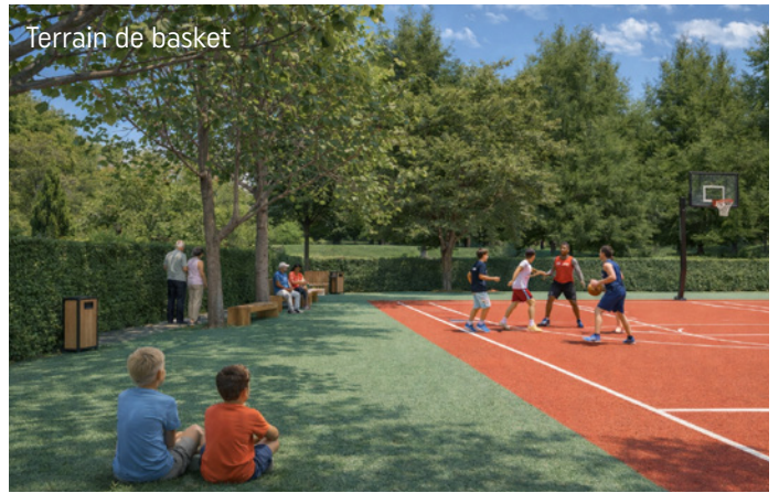
Terrain de basket